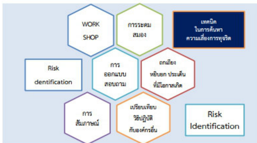
เทคนิคในการ ระบุความเสี่ยง หรือค้นหาความเสี่ยงการทุจริตด้วยวิธีการต่าง ๆ ดังนี้